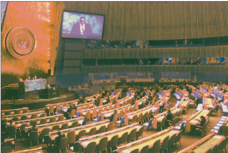
Một phiên họp của Đại hội đồng Liên