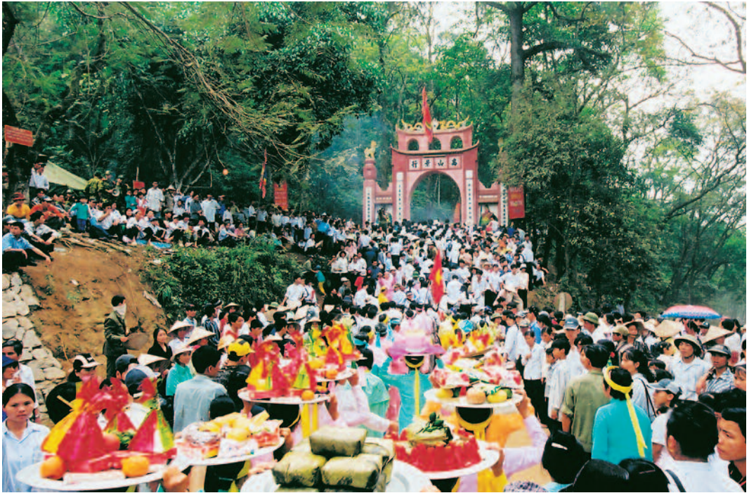
Giỗ Tổ Hùng Vương