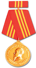
HUÂN CHƯƠNG HỒ CHÍ MINH