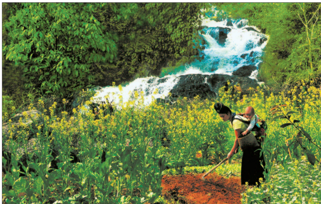
Mẹ địu con làm nông