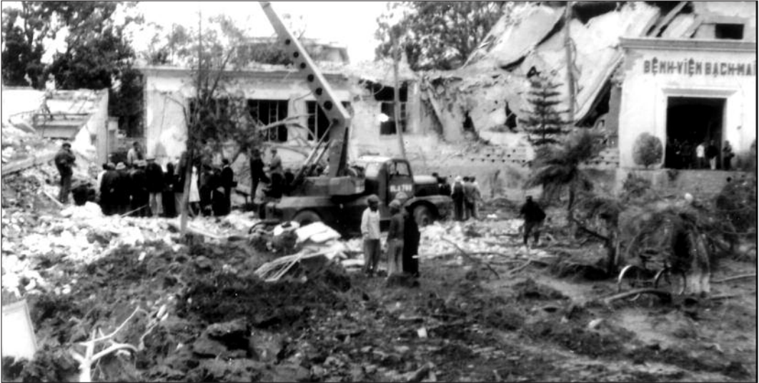
Bệnh viện Bạch Mai (Hà Nội) bị máy bay Mỹ ném bom ngày 26 tháng 12 năm 1972