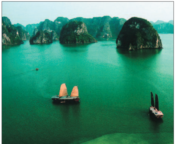
Vịnh Hạ Long