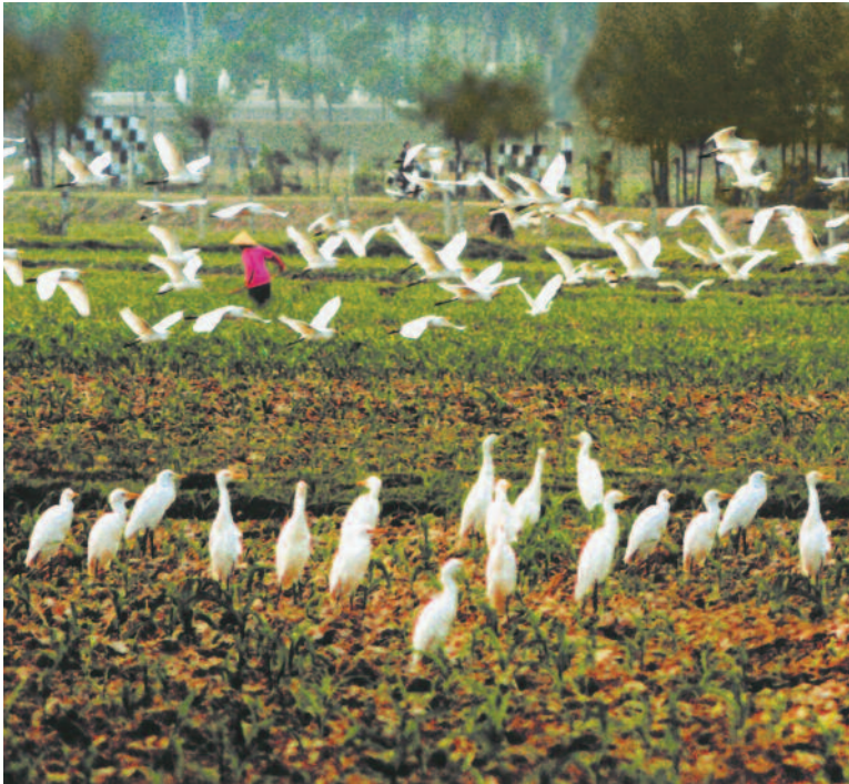
Miền quê thanh bình