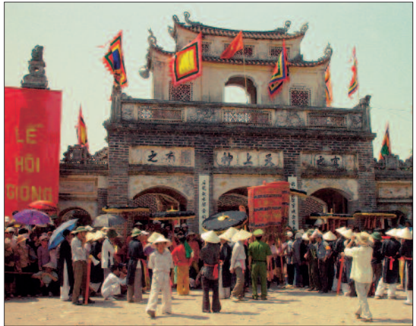
Lễ hội Đền Gióng (Phù Đổng, Gia Lâm, H Nội.)

- Tính đến năm 2005, Việt Nam có Vịnh Hạ Long, Cố đô Huế, Phố cổ Hội An, Di tích Mỹ Sơn, Vườn quốc gia Phong Nha - Kẻ Bàng, Nhã nhạc cung đình Huế, Không gian văn hoá công viên Tây Nguyên đã được UNESCO công nhận là di sản thế giới.