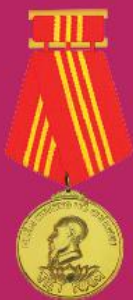
HUÂN CHƯƠNG HỒ CHÍ MINH