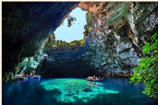
Vườn quốc gia Phong Nha – Kẻ Bàng