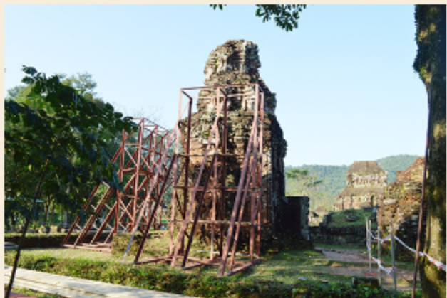
Trùng tu khu di tích Thánh địa Mỹ Sơn