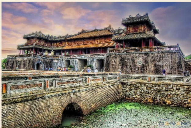
Cố đô Huế

Theo em, ngành du lịch cần phải làm gì để góp phần bảo tồn và phát huy giá trị di sản văn hóa và di sản thiên nhiên?