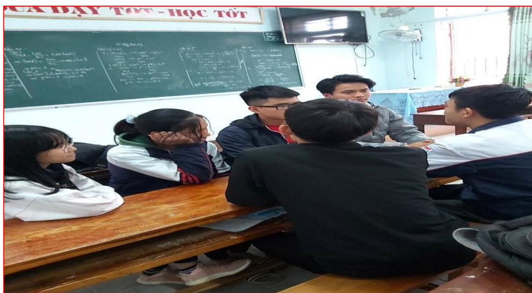
Cán bộ lớp đang tâm sự, chia sẻ 2 học sinh hay đi học muộn

Ý thức của những em cán bộ lớp thường là rất tốt, chấp hành tốt nội quy và bạn bè cùng trang lứa với những học sinh hay đi học muộn nên nếu giáo viên chủ nhiệm biết vận dụng điều này thì giao cho cán bộ lớp tâm sự, chia sẻ, động viên, khuyên bảo những em học sinh hay đi học muộn để làm thay đổi suy nghĩ theo hướng tích cực của những em học sinh đó.