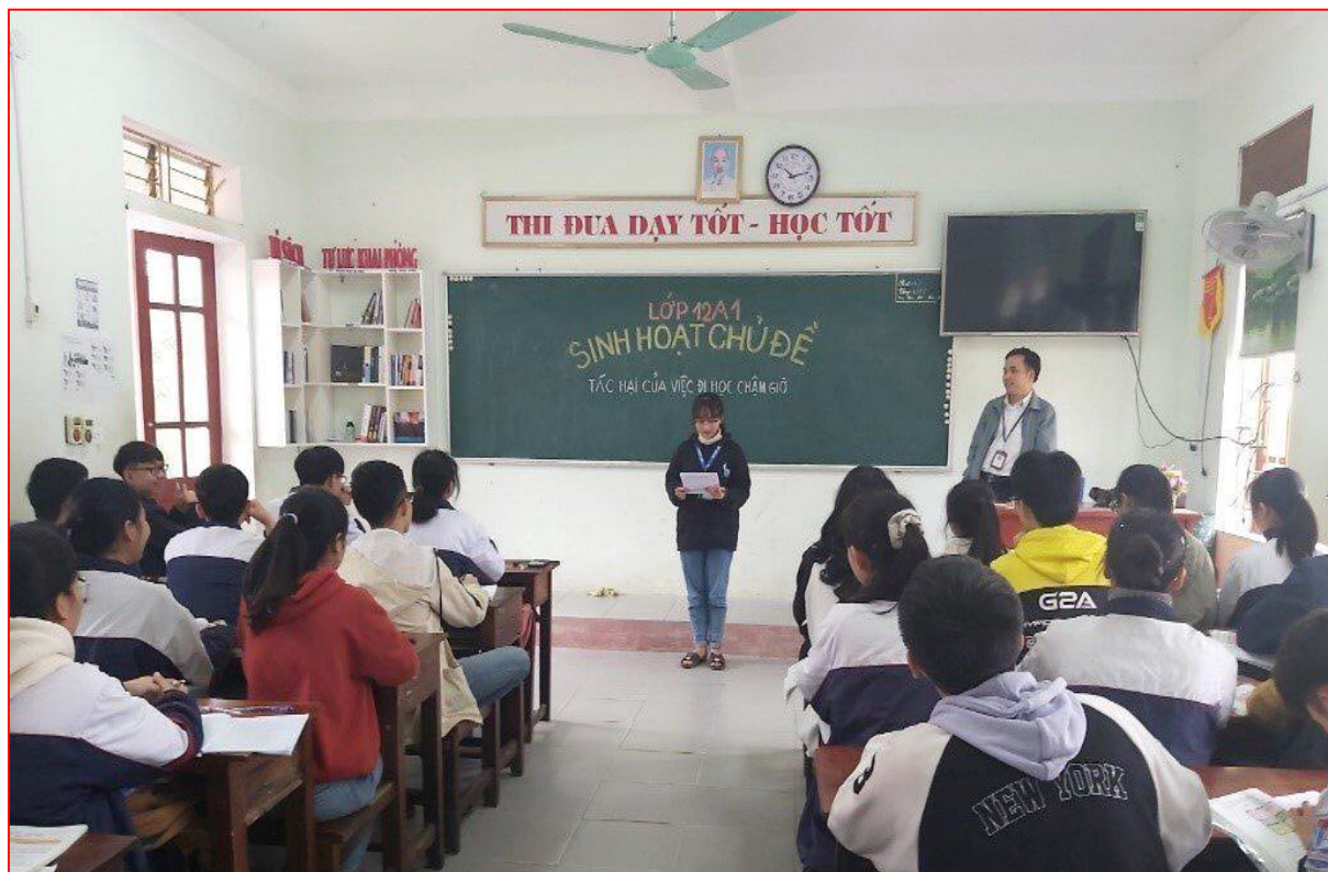
Trường THPT Nguyễn Xuân Ôn Lớp 12A1-Năm học 2021-2022

Thứ 7- Ngày 23/10/2021- sinh hoạt chủ đề: “Tác hại của việc đi học muộn giờ”.