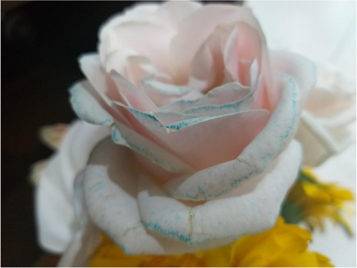
Hoa sau khi thí nghiệm