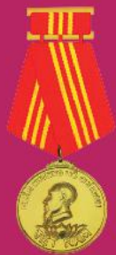
HUÂN CHƯƠNG HỒ CHÍ MINH