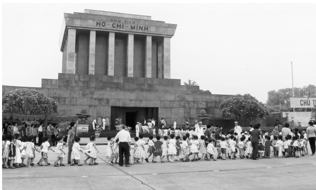
Lăng Chủ tịch Hồ Chí Minh

Mai về miền Nam thương trào nước mắt Muốn làm con chim hót quanh lăng Bác Muốn làm đoá hoa toả hương đâu đây Muốn làm cây tre trung hiếu (3) chốn này.