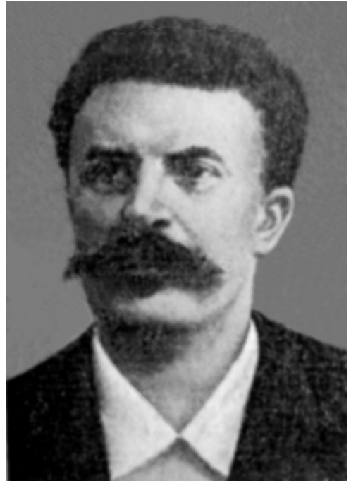
G. ĐƠ MÔ-PA-XĂNG

Văn bản Bố của Xi-mông trích truyện ngắn cùng tên. Chị Blăng-sốt trong truyện này bị một người đàn ông lừa dối, sinh ra Xi-mông. Vì vậy, Xi-mông trở thành một đứa trẻ không có bố dưới con mắt mọi người. Truyện bắt đầu khi Xi-mông lúc đó khoảng bảy, tám tuổi, lần đầu tiên đến trường bị đám học trò chế giễu là không có bố.