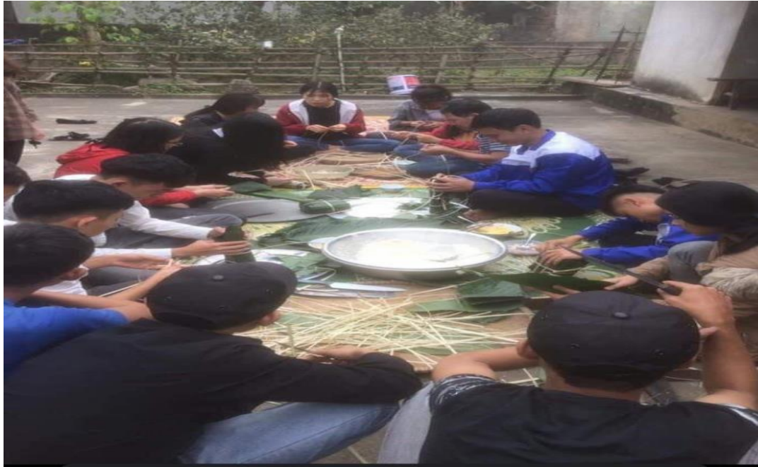
Gói bánh chưng tại nhà học sinh của lớp 10C