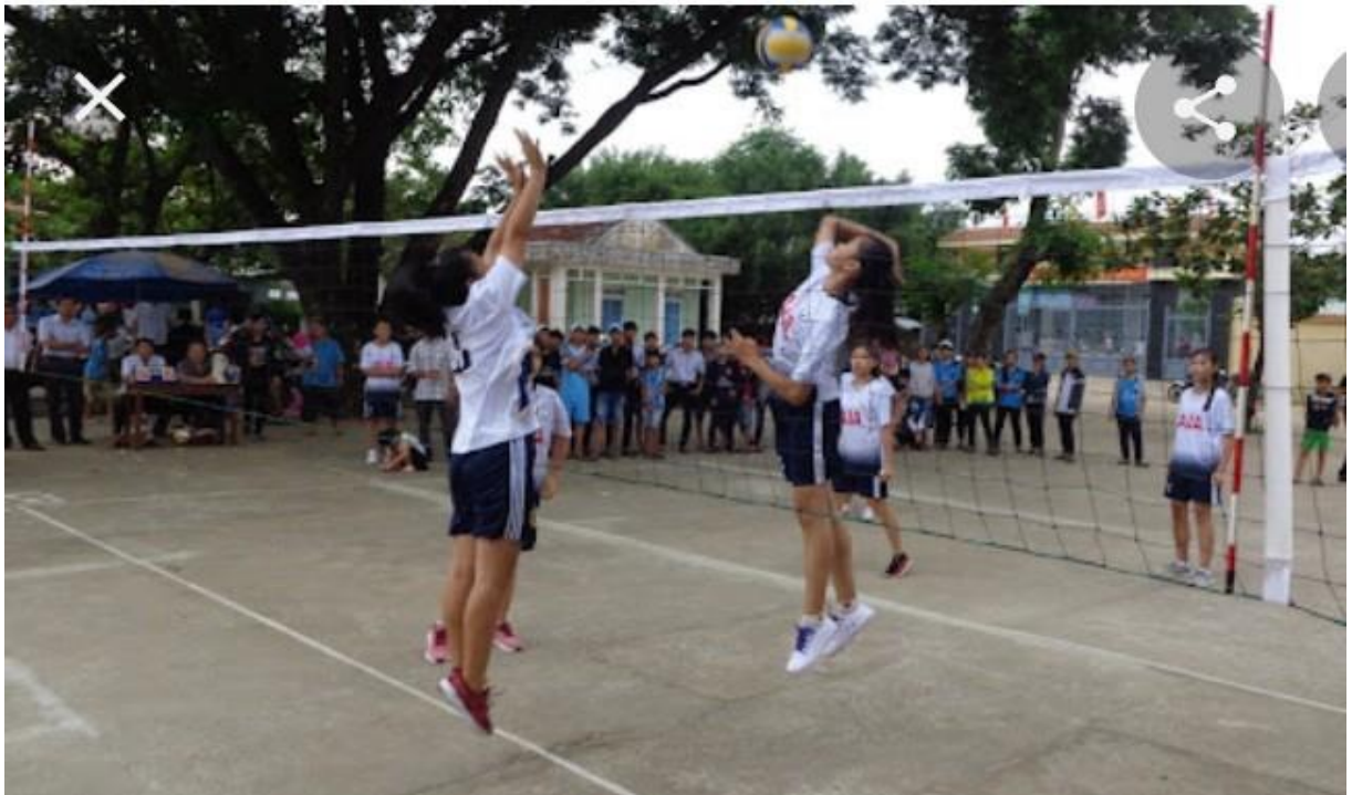
Hình 5-6-7-8: Hình ảnh hoạt động rèn luyện thể dục thể thao của lớp 10C.