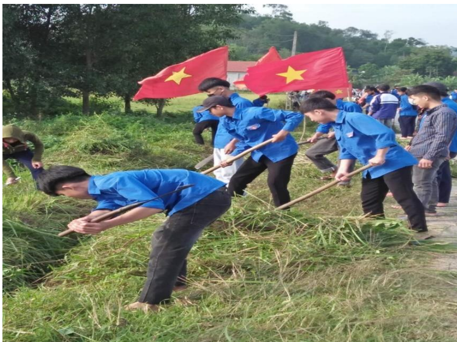
Lao động công ích của lớp 10C trong khuôn viên trường