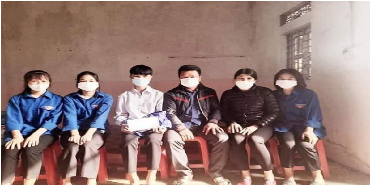
Tập thể lớp 10C và GVCN tặng quà “Đông ấm cho em”