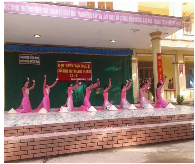
Tiết mục múa “Việt Nam quê hương tôi” của chi đoàn 10C- Đạt giải nhì