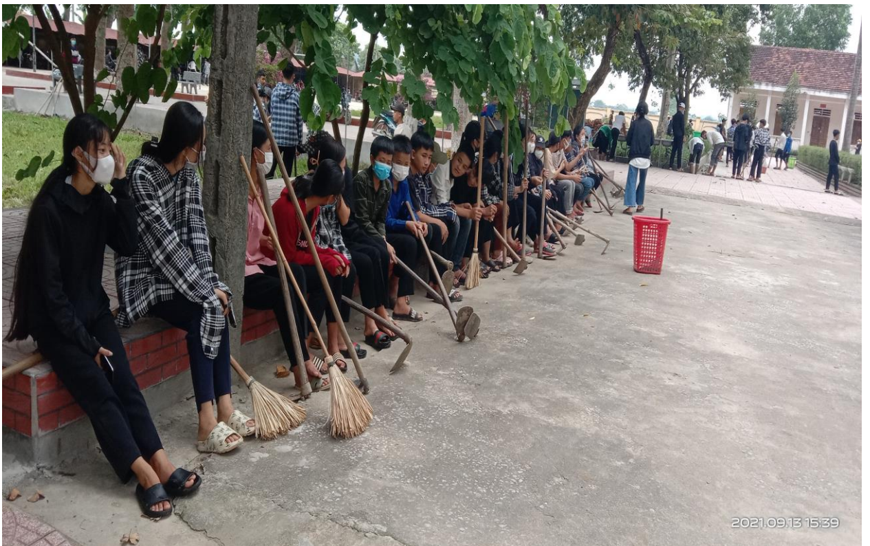
Hình 3-4: Hình ảnh trước buổi lao động công ích tại trường của lớp 10C.