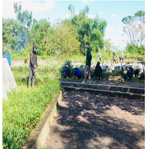
Tập thể lớp 10C vệ sinh, cuộc dọn khuôn viên nghĩa trang xã Thanh Liên