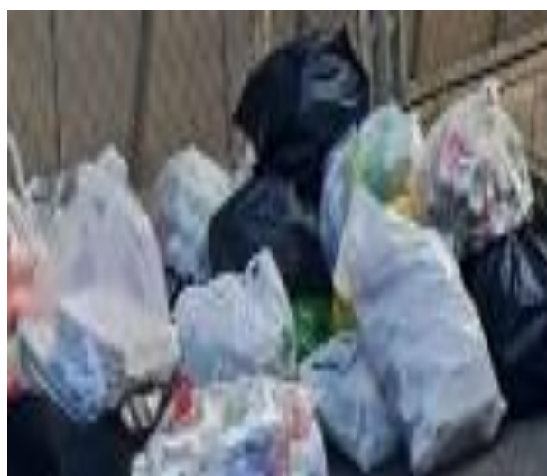
Hình ảnh thu gom phế liệu để gây quỹ đông ấm cho em của lớp 10C