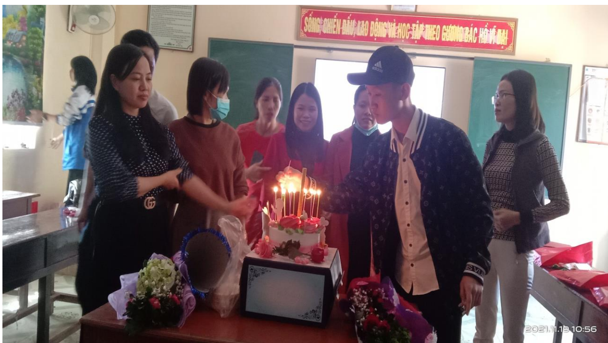
Hình 1-2: Hoạt động tri ân thầy cô nhân ngày Nhà giáo Việt Nam 20-11.