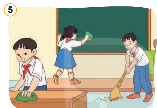
Giữ gìn, bảo vệ của công