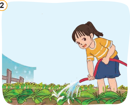
Giúp đỡ bố mẹ những công việc phù hợp