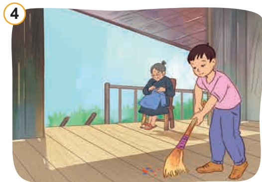
Giúp đỡ người có hoàn cảnh khó khăn