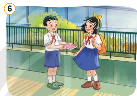
Thương yêu, đoàn kết, giúp đỡ bạn bè