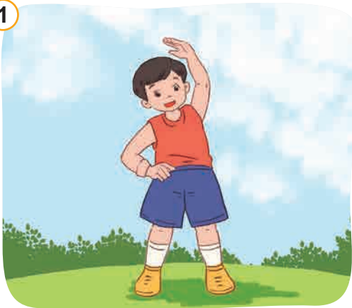
Giữ gìn vệ sinh, rèn luyện thân thể