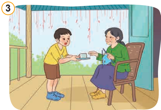
Kính trọng, hiếu thảo với ông bà, cha mẹ